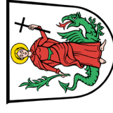
Ludwig Reger Erster Bürgermeister